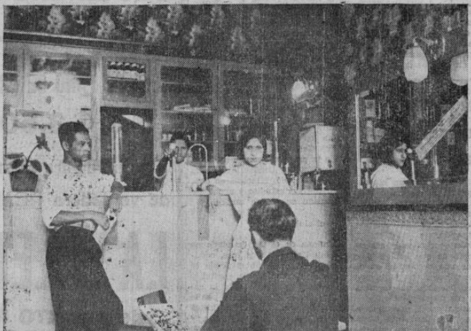
UNA PARTE DEL SALON PARA EL SERVICIO PUBLICO, EXQUISITAMENTE ATENDIDO